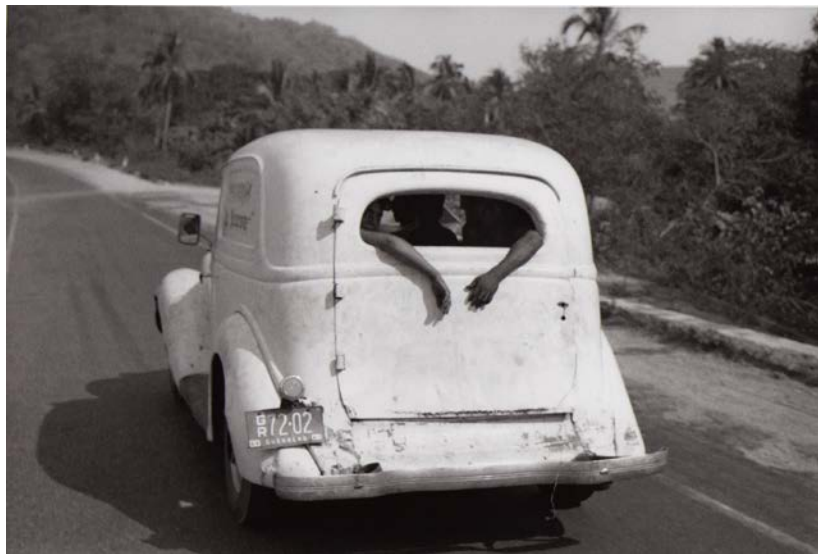
Bernard Plossu, Sur la route d'Acapulco , Mexique, 1966, série « Le Voyage mexicain », tirage gélantino-argentique, 18 × 27 cm. Courtesy de l'artiste / Galerie Camera Obscura, Paris. © Bernard Plossu.

L'automobile et le développement des autoroutes offrent de nouveaux grains à moudre aux photographes, des rubans d'asphalte et vertigineux échangeurs des mégapoles, un « sublime accéléré », comme le résume la photographe Sue Barr, qui a capturé à Naples ce point de vue surréaliste : une petite bâtisse ancienne coincée, ou plutôt étouffée, sous les